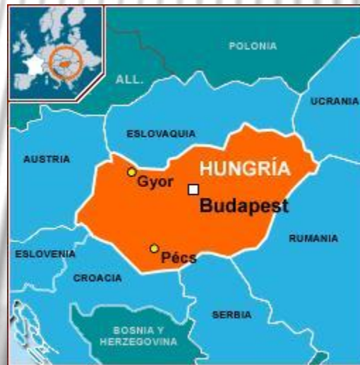
Hungría y países limítrofes.