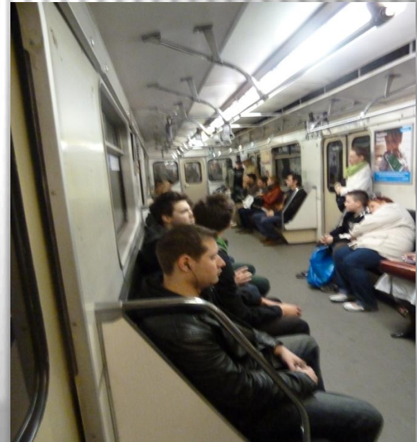
Metro: Línea 3